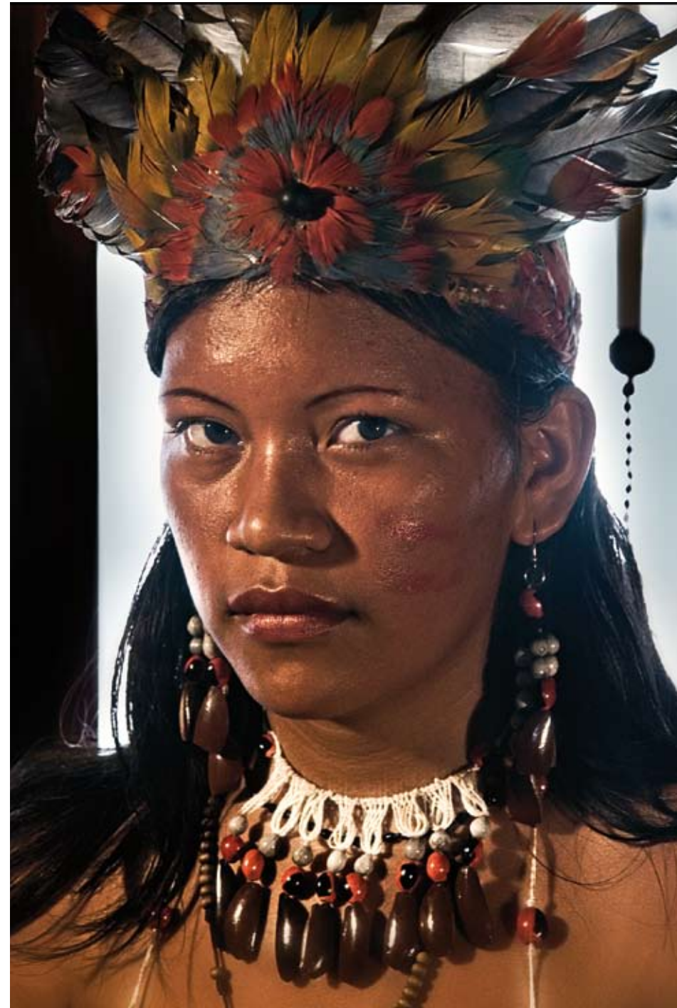
Mujer quichua con atuendo festivo.