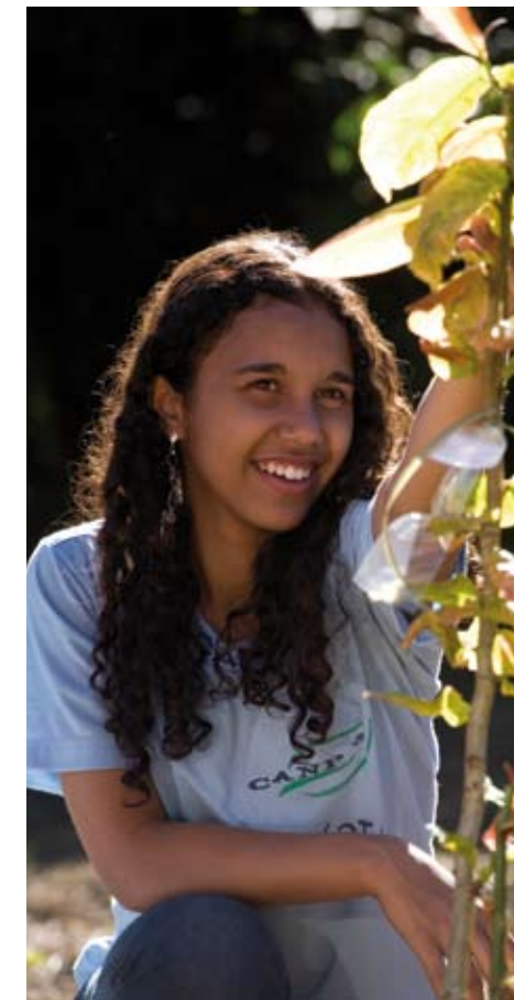
Proyecto Florestas do Futuro, Brasil.

En 2009 hemos seguido dialogando con las comunidades guaraníes de Itika Guasu, en Bolivia, que habitan en el campo Margarita, al no haberse alcanzado un acuerdo con esta comunidad. Repsol YPF ha mantenido en 2009 conversaciones con Yacimientos Petrolíferos Fiscales Bolivianos (YPFB), la compañía petrolera estatal de Bolivia que mantiene una