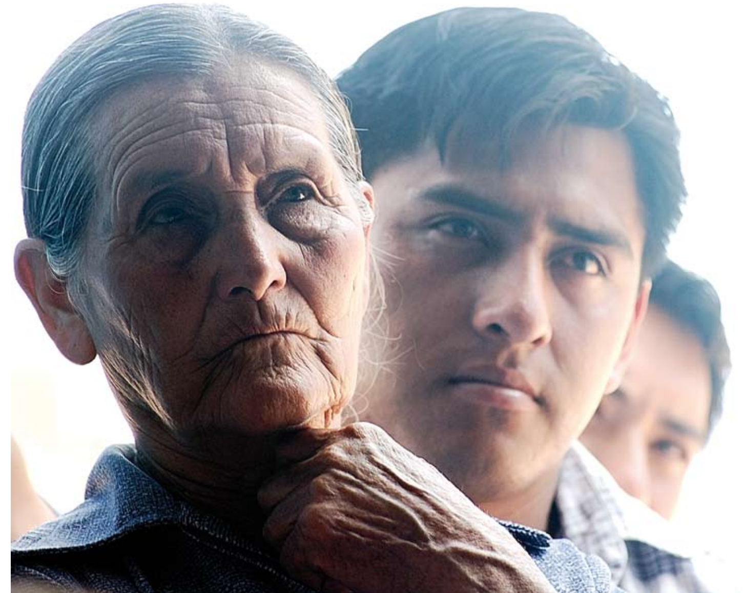
Habitantes de Huacaya (Bolivia), donde Repsol realiza actividades de exploración y producción.

Las condiciones generales de compras y contrataciones de Repsol YPF obligan a las empresas adjudicatarias, en cualquier lugar