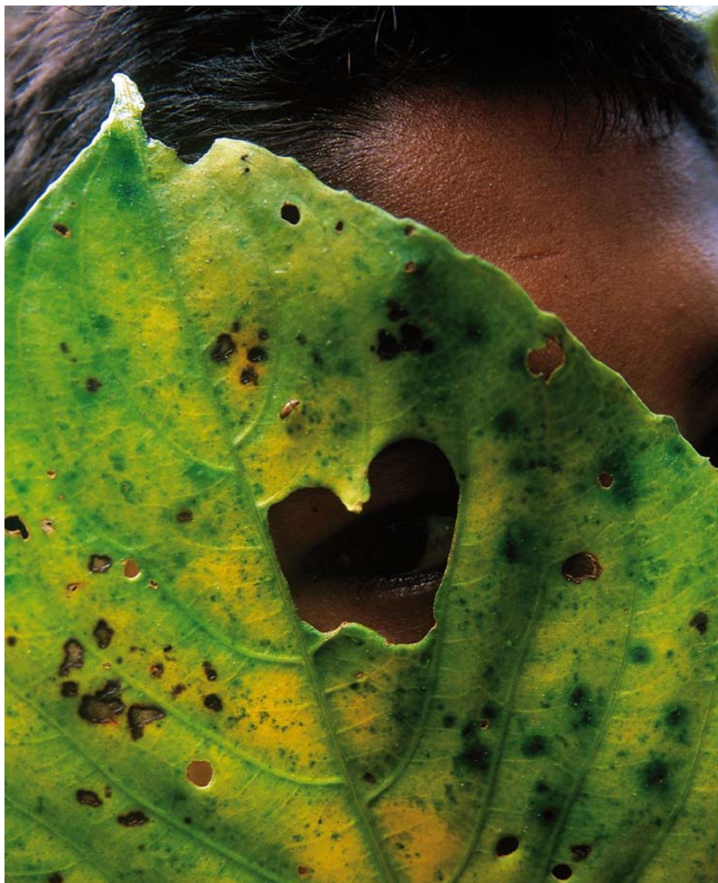
Imagen tomada en la Amazonía peruana cedida por la Fundación Repsol.