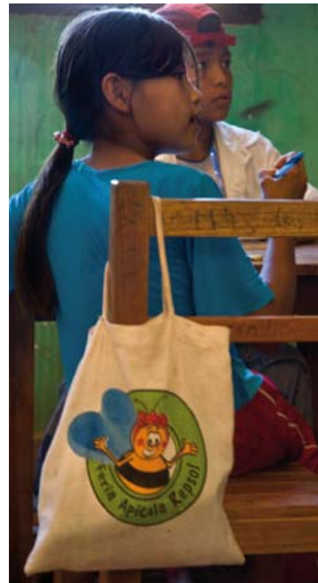
Proyecto educativo en Bolivia.

• Venezuela: colaboración con la Dirección de Salud Indígena para el desarrollo de proyectos que mitiguen las necesidades en materia de salud de la población indígena del estado de Monagas.