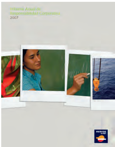
Informe Anual de Responsabilidad Corporativa 2007