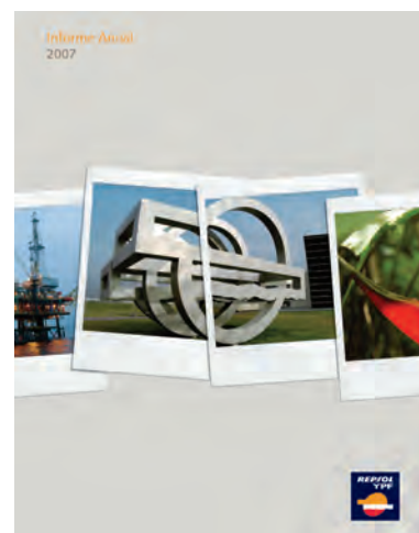
Informe Anual 2007

Asimismo, la información contenida en repsolypf.com completa y amplía la información divulgada en este informe. En la sección denominada Responsabilidad Corporativa puede encontrar información adicional acerca de los aspectos y casos de estudio tratados en este informe.