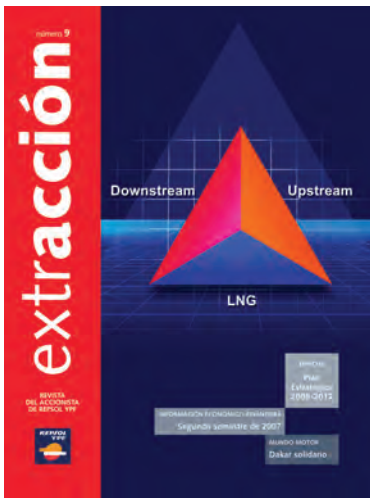
Extracción, revista del accionista de Repsol YPF