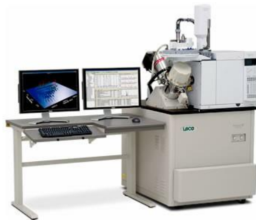
Cromatógrafo de gases bidimensional acoplado a un espectrómetro de masas de tiempo de vuelo (GCxGC-TOFMS)