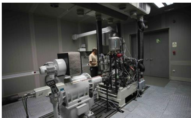
Imagen de celda de ensayos motor