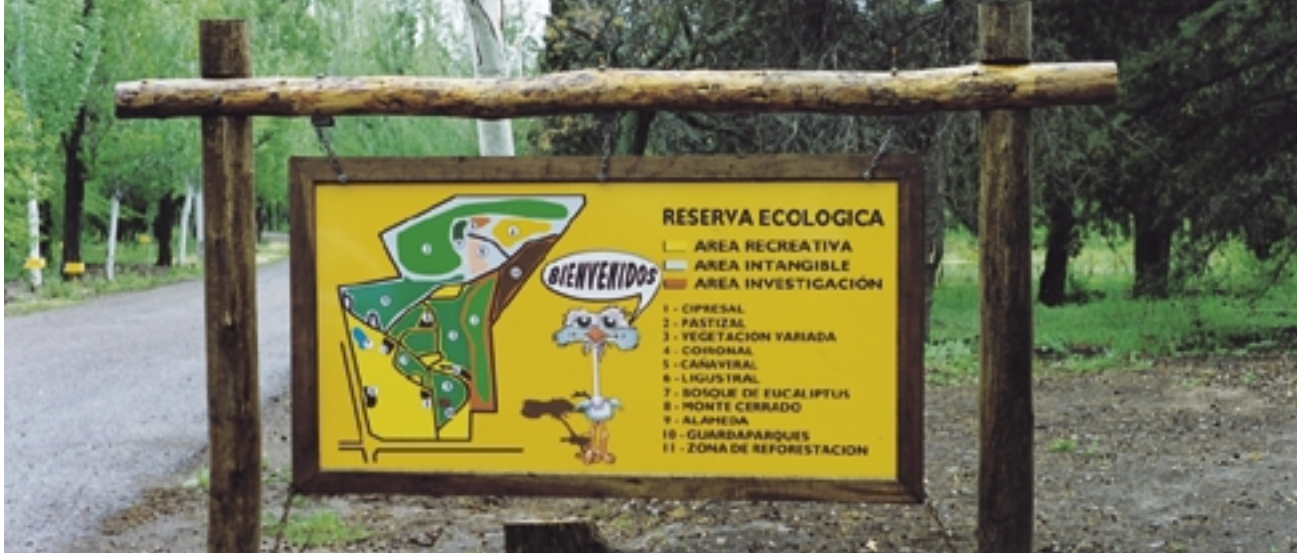
La atención a la comunidad se incluye entre los elementos de la política medioambiental de Repsol YPF.

breve posible con mecanismos de gestión y una cultura medioambientales comunes.