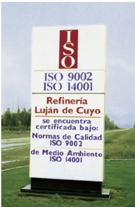
En Argentina Repsol YPF tiene una amplia experiencia en certificación ISO 14.001.

Junto a la elaboración y seguimiento del PEMA, el Plan de Auditorías Medioambientales de Repsol YPF es un medio básico para hacer realidad el principio de Mejora Continua establecido en la Política Medioambiental. El Plan establece que los centros industriales de la Compañía deben someterse a un ciclo completo de auditoría ambiental al menos cada tres años, siendo habitual que los grandes centros (refinerías de petróleo,